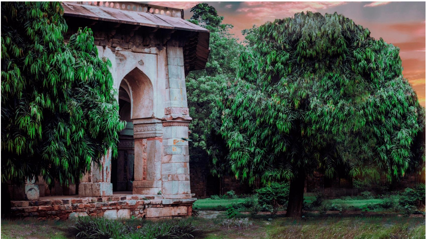
Le jardin à Echbatane