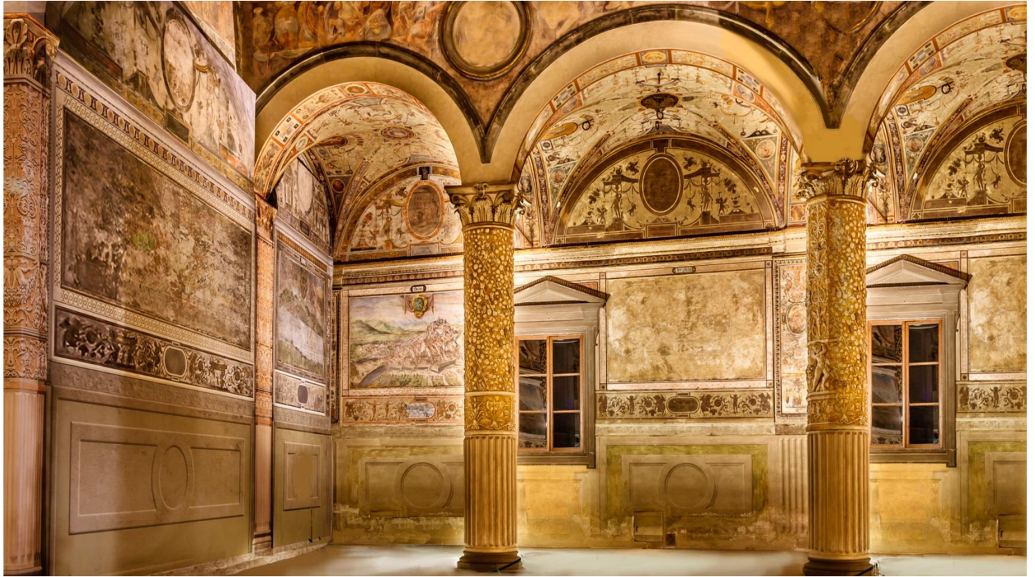
Le palais d'Echbatane