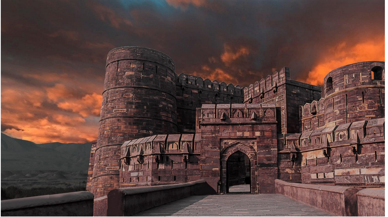
La Porte de Ninive