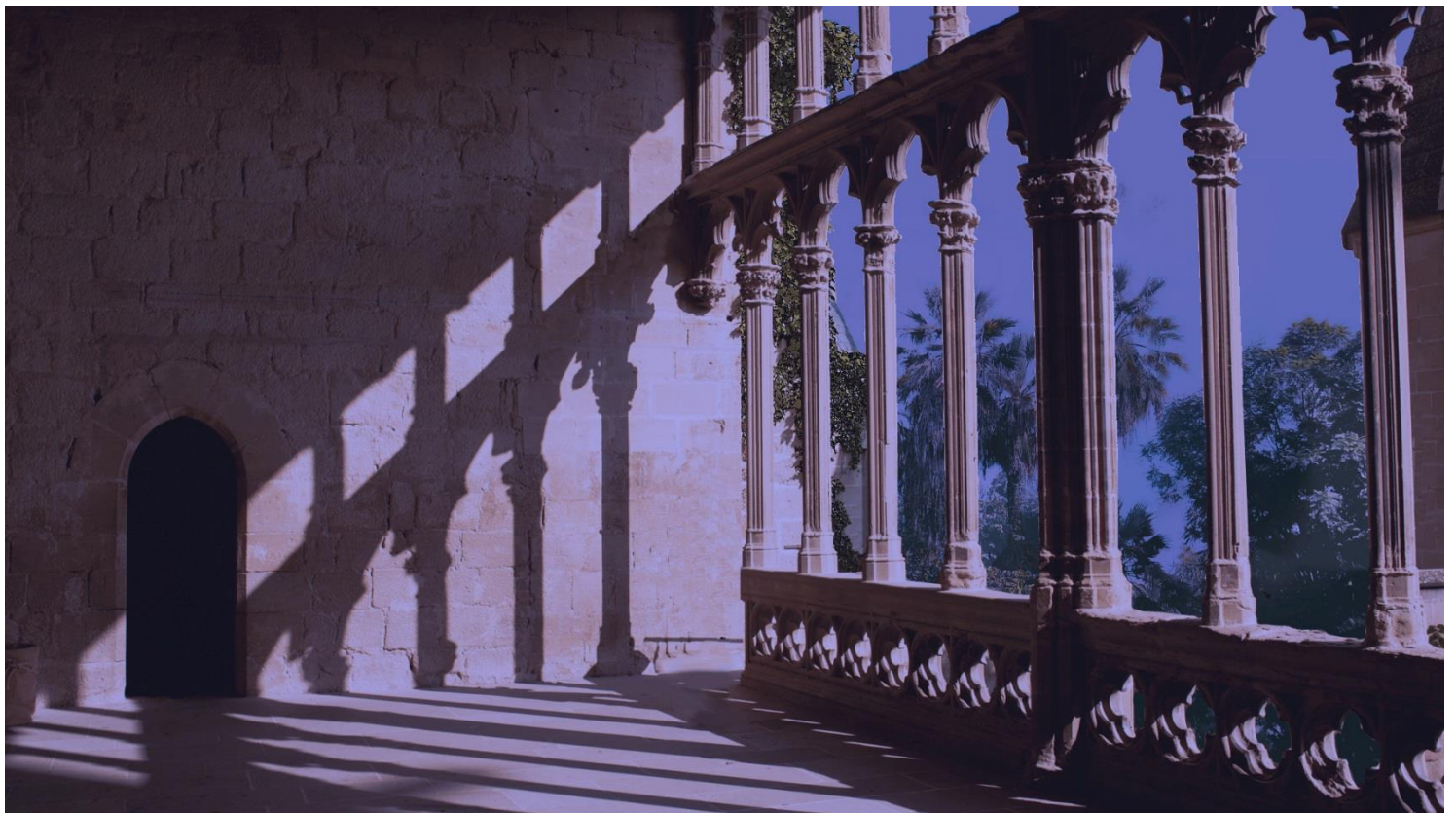
Le balcon de la chambre de Sarra